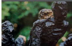
Het Nationaal Monument Slavernijverleden in het Oosterpark in Amsterdam